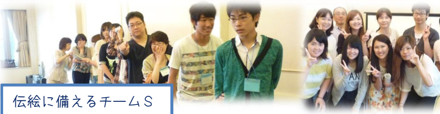
伝絵に備えるチームS