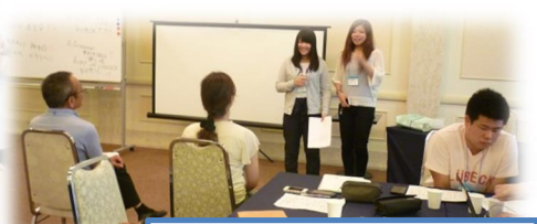
リハーサル中のチームE