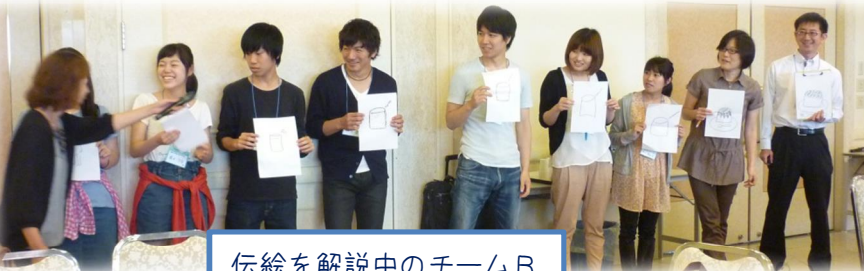
伝絵を解説中のチームB