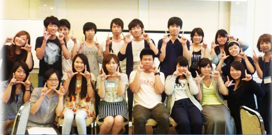
第12回ENS京都実行委員会

6月28日～29日に本番会場の琵琶湖グランドホテルで第12回ENS→B (Egg Nurse Step to Being) 現地実行委員会がおこなわれました。