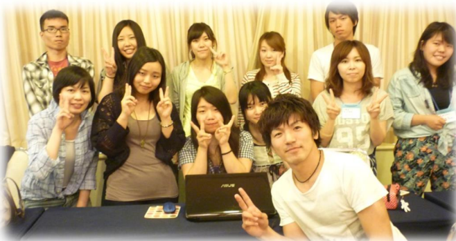
企画をまとめたチームN