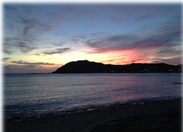
丹後の久美浜です