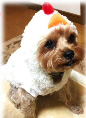
愛犬ショコラです！