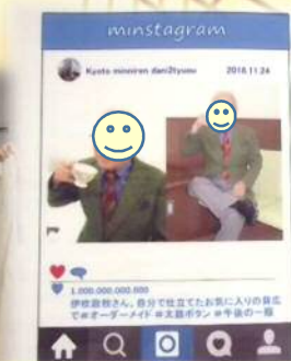
若かりし頃の一張羅を着て写真撮影