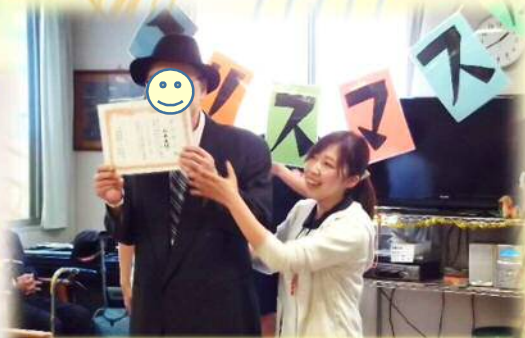
4部門のダンディー部門優勝者