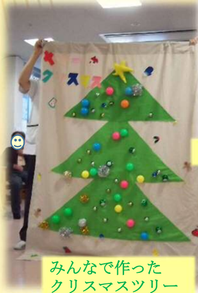
みんなで作った クリスマスツリー