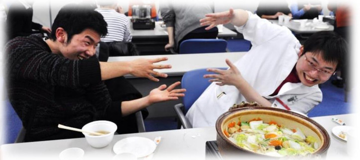
↑↑↑とても気さくな石井先生(*^ω^*)ニコッ